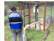
Bettancourt con Coexca S.A. Ver todo