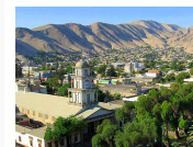
Agrupación de agricultores cránceros y parceleros Sector Bajo del Río Copiapó con Superintendencia del Medio Ambiente y otros (Caso de Planta de Tratamiento de Aguas Servidas San Pedro). Ver todo