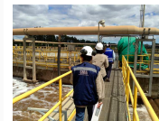
Celulosa Arauco y Constitución S.A. con Superintendencia del Medio Ambiente. Ver todo