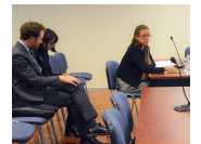
Sociedad Gastronómica Macul Ltda. con Superintendencia del Medio Ambiente. Ver todo